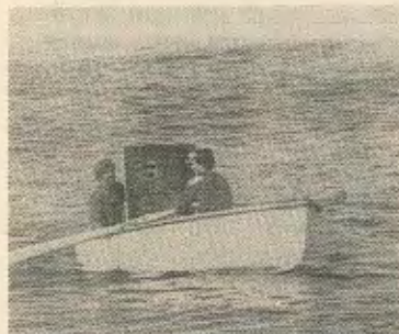
ηγείτο της παράνομης οργάνωσης Ε.Ο.Κ.Α.—Β.

Η Κυβέρνηση σαν γνήσιος εκπρόσωπος της δεξιάς προσπαθεί να ταυτίσει τον Γρίβα με τον απελευθερωτικό αγώνα του 55-59 και να παραγνώρισει τις φασιστικές-του δραστηριότητες, όπου σαν αρχηγός της οργάνωσης «Χ» στην Ελλάδα καθοδηγούσε σε συνεργασία με τους Άγγλους τις εχτελέσεις ανταρτων αγωνιστών του Ελληνικού Λαϊκού Απελευθερωτικού Στρατου (ΕΛΛΑΣ) που πάλευαν ενάντια στα φασιστικά στρατεύματα του Χίτλερ. Μετέπειτα στην Κύπρο